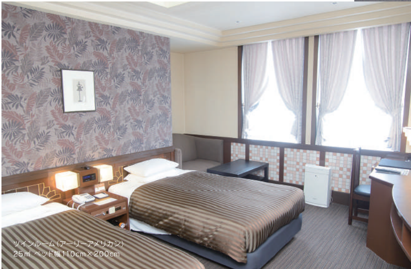
ツインルーム(アリーアメリカン) 25㎡ ベッド幅110cm×200cm