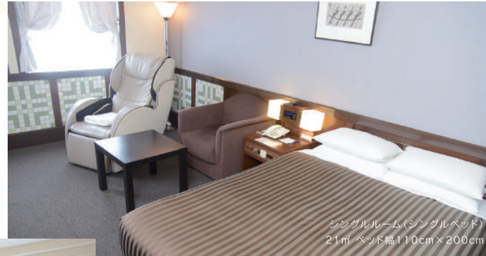
シングルルーム(シングルベッド) 21㎡ ベッド幅110cm×200cm

全客室が21㎡以上でちょっと贅沢で、プライベートには最適なゆとりある広さ。ユニットバスには、足を伸ばせるほどの大きめのバスタブがあり、旅の疲れを十分に癒してくれます。デザインはレトロで温かみのあるタイル張りのアールデコタイプと、優しい雰囲気のアリーアメリカンの2タイプをご用意しております。