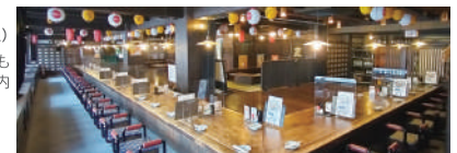
【博多赤らく】 TEL:092-472-1115(直通) 九州の旬の食材と季節の風情を盛り込んだ伝統的な日本料理店。