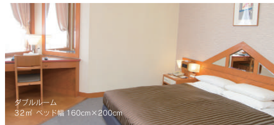
ダブルルーム 32㎡ ベッド幅160cm×200cm