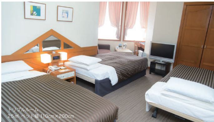
トリプルルーム 25㎡ ベッド幅110cm×200cm

インターネット(Wi-Fi)、共通アメニティ・設置アイテム、貸出備品、テレビ、冷蔵庫、電話、空調、加湿機能付空気清浄機、温水洗浄便座