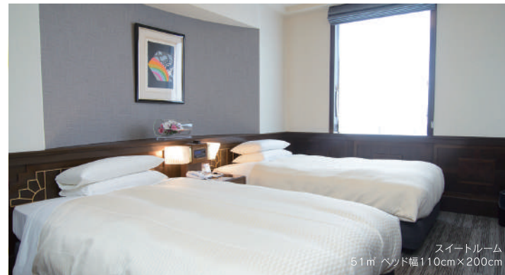
スイートルーム 51㎡ ベッド幅110cm×200cm