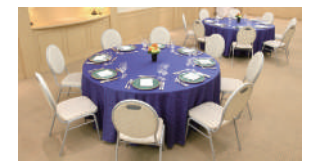
中宴会場「ラベンダー」